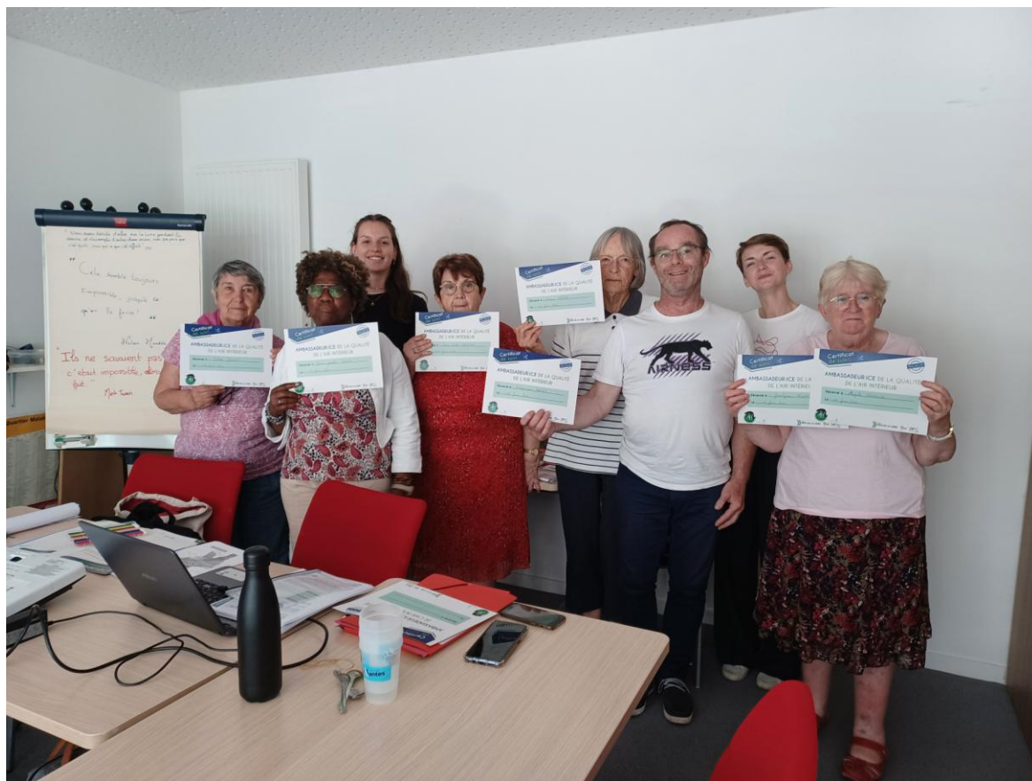
Le groupe des Ambassadeur.ices du Quartier Malakoff- Nantes