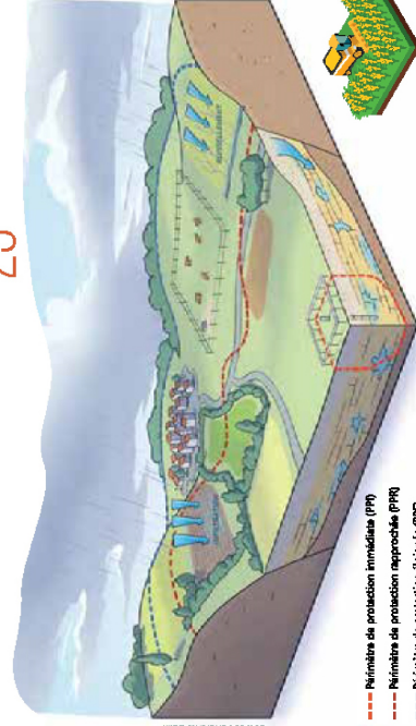
Source : Charente-Eaux - - - Périmètre de production immédiate (PII) - - - - - Périmètre de production rapprochée (PIR) - - - - - Périmètre de production éloignée (PIE)

7 850 EXPLOITATIONS AGRICOLES CONCERNÉES